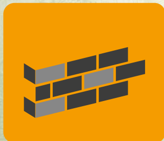
Ściany zewnętrzne oraz wewnętrzne, oddzielające pomieszczenia ogrzewane od nieogrzewanych