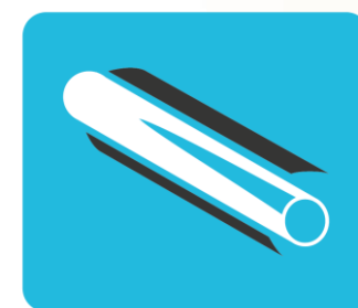
Centralne ogrzewanie i ciepła woda użytkowa