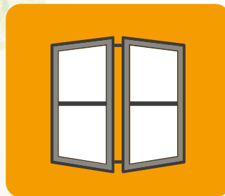
Stolarka okienna i drzwiowa