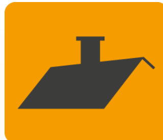
Dach lub strop