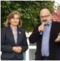
width="100"] KODAK Digital Still Camera[/caption][caption id="attachment_51913"