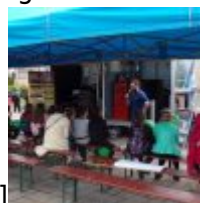
id="attachment_51905" align="alignnone" width="100"] KODAK Digital Still