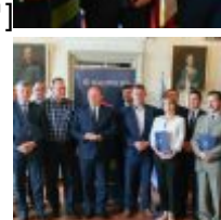
CSC[/caption][caption id="attachment_49330" align="alignnone" width="100"] SAMSUNG