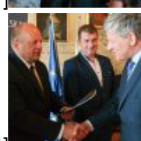
CSC[/caption][caption id="attachment_49328" align="alignnone" width="100"] SAMSUNG