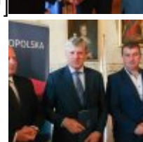
CSC[/caption][caption id="attachment_49329" align="alignnone" width="100"] SAMSUNG