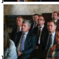
CSC[/caption][caption id="attachment_49327" align="alignnone" width="100"] SAMSUNG