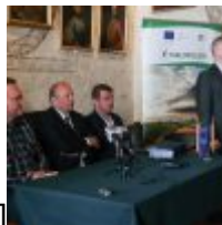
[caption id="attachment_49324" align="alignnone" width="100"] SAMSUNG