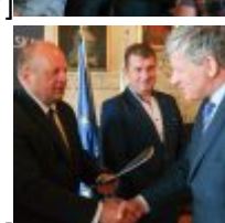
CSC[/caption][caption id="attachment_49328" align="alignnone" width="100"] SAMSUNG