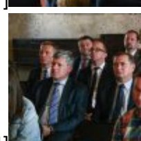
CSC[/caption][caption id="attachment_49327" align="alignnone" width="100"] SAMSUNG