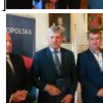
CSC[/caption][caption id="attachment_49329" align="alignnone" width="100"] SAMSUNG