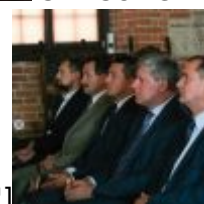
CSC[/caption][caption id="attachment_49325" align="alignnone" width="100"] SAMSUNG